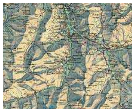
그림 2. 남동 광원 "Carte de voyage des grisons" (section), 1:250000, 1932.