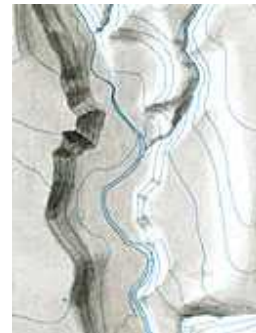
그림 4. 평평한 영역을 위한 명암

그림 4 에서는 약간 높은 대지(臺地)보다 평평한 지역이 더 어둡게 표현된 것을 보여준다. 경사부분이 전체지역을 특징지우면서 전체적으로 3차원적인 효과가 잘 나타나고 있다.