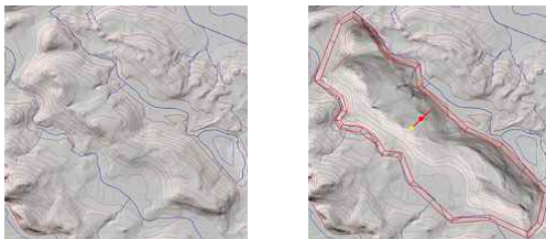
그림 7. 빛 방향의 국지적 조정

지역조정은 CAD에서 도입된 fence라는 개념을 사용하여 빛 방향을 포함하는 몇 개의 음영변수를 지역적으로 조정하는 것이다. Fence를 사용하기 위해 사용자는 DEM의 부분을 격리시키기 위한 경계부분을 그린다. 그 경계안에서 매개변수를 조정하여 음영기복도의 외모를 국지적으로 조정할 수 있다. 즉 음영기복도를 생산할 때 중요한 지형의 빛 방향과 밝음을 선택적으로 조정해야 한다. 그림 7은 fence 안에 빛 방향을 조정하기 전과 후이다. 전체적으로 북서쪽에서 빛을 받는 음영기복도에서 fence 내부만을 남서쪽에서 빛을 줌으로써, 북서 방향으로 되어 있는 산등성이가 보다 명확하게 표현되었다.