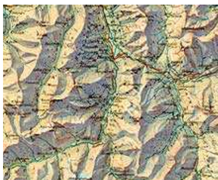
그림 1. 북서 광원 "Graubunden" (section), 1:250000, 1945.

또한 전형적인 음영기복도의 최적의 빛의 연직각은 산마루와 골짜기를 대략 수평에서부