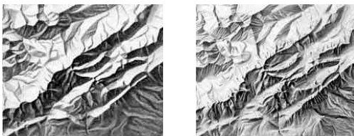
그림 5. 기복일반화

그림 5의 두 이미지 중 원편의 이미지는 오른쪽의 것보다 덜 상세하다. 하지만 상세한 정도가 음영기복의 우수성을 가리는 기준이 되지 못한다. 기복 일반화의 적정 수준은 주어진 지도의 디자인 목표와 사용자가 누구냐에 따라 다르다.