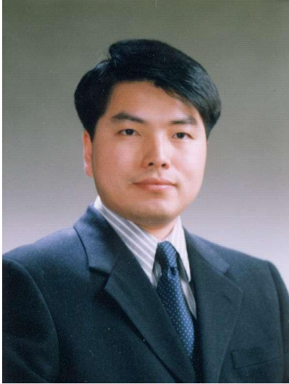
글 | 전철민 서울시립대 교수